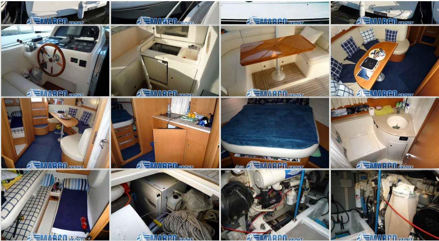
Uniesse Open 42''