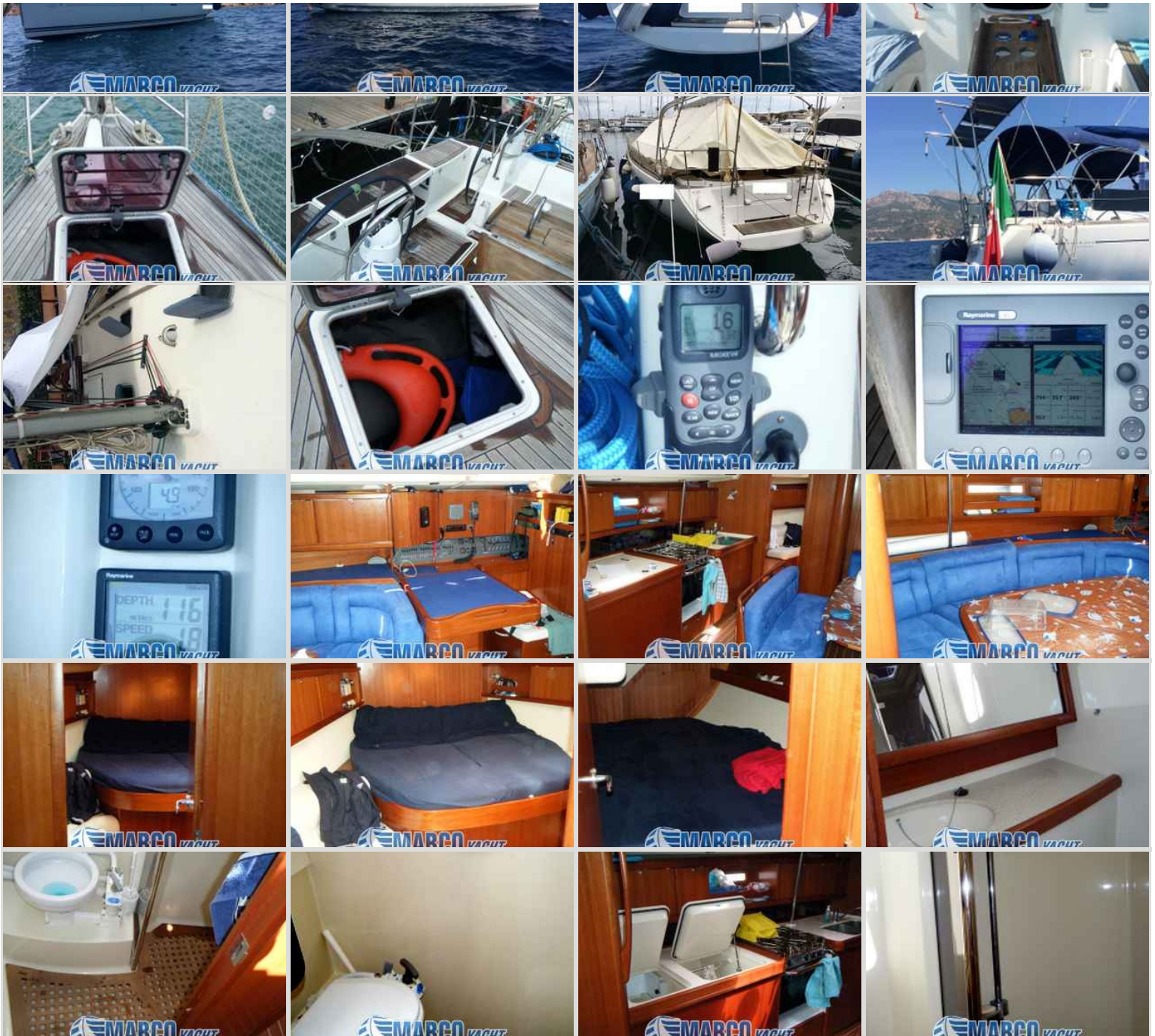
DUFOUR 455 grand large