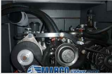
Jeanneau Sun odyssey 54 ds